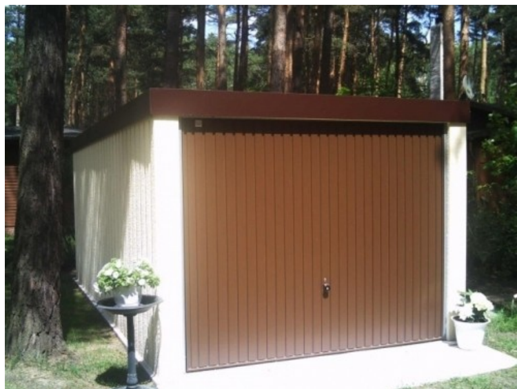
Brandschutz auch in Exklusiv-Garagen erforderlich

An Wohnzimmer oder Bastelkeller werden andere Maßstäbe angelegt als an Garagen von www.Exklusiv-Garagen.de . Was haben ein Teppich, ein Benzinkanister und eine Gasflasche in einer Exklusiv-Garage verloren? Nichts, auch wenn der Garagenhersteller aus Bad Salzuflen nur Stahlfertiggaragen baut, die einem Feuer wenig Futter bieten. Ein Bastler löste in seiner Uraltgarage durch ein Heizgerät eine fatale Kettenreaktion aus. Statt sich warm anzuziehen oder sich an seinem Kachelofen aufzuwärmen, entfachte er leichtsinnig mit seinem Propanheizkörper ein brennend heißes Experiment. Mit großem Erfolg: Erst brannte der Teppich, dann die unsichtbaren Dämpfe aus dem undichten Benzinkanister und schließlich das aus der Gasflasche entweichende Propan. Das Klapptor aus Holz bildete den lichterloh brennenden Rahmen für das beschauliche Ambiente der kleinen, aber wenig feinen Bastlerwelt. Verpuffende Benzindämpfe werden regelmäßig unterschätzt. Leicht werden Temperaturen von mehreren hundert Grad Celsius erreicht. Der Initiator des Schauspiels verbrannte sich an seinen Händen und in seinem Gesicht. [1] Ein wirksamer Brandschutz setzt an den Gegenständen an, die in einer Garage gelagert sind. Diese brennen schnell und lichterloh, sobald sie die Zündtemperatur überschritten haben.